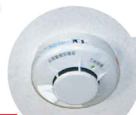
住宅用火災警報器 Fire alarms for residential properties Alarme de Incêndio Residencial

Atenção: O Alarme de Incêndio Residencial mais comum é movido a bateria. A vida útil da bateria é normalmente estimada entre 5 a 10 anos, mas tente trocar o quanto antes.