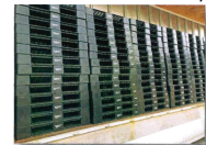
paletes, peças para eletrodomésticos, etc