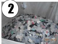
Os materiais coletados são triturados em pedaços menores