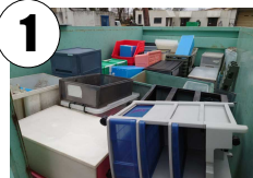
Os materiais de plástico recolhidos são levados para a empresa especializada