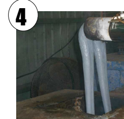
Depois são derretida, e esticada como um fio