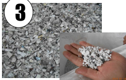
Os plásticos triturados são classificados de acordo com o tipo de plástico PE e PS