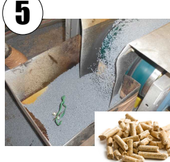
Estes fios são cortados em tubinhos, o qual chamamos pelotas, serão matéria-prima para novos produtos